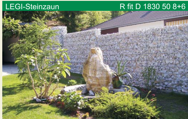
Der LEGI-Steinzaun ist kompatibel mit allen LEGI-R-Zaunsystemen .

Der LEGI-Steinzaun bietet sich hervorragend für den Bewuchs von Kletterpflanzen an und schafft durch wasser- und luftdurchlässige Hohlräume wertvolle ökologische Inseln.